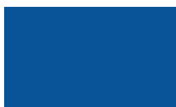
Cor: 5007 250/300 cm