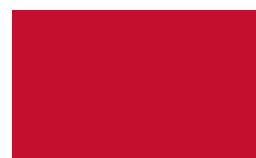
Cor: 3302 150/300 cm