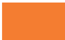
Cor: 3301 150/300 cm