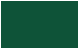
Cor: 6038 300 cm