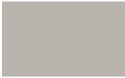
Cor: 7001 300 cm