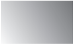
Cor: 7500 300/320 cm