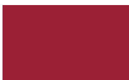
Color: 3088 150/300 cm