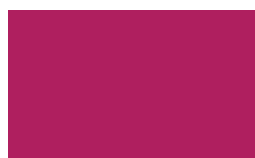
Color: 3129 150/300 cm