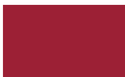
Color: 3006 150/300 cm